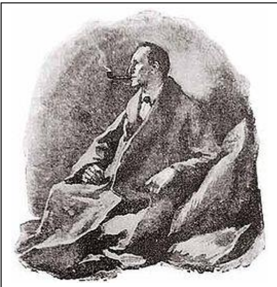
Tegning af Sherlock Holmes ved Sidney Paget.

MEN hvor fik Conan Doyle så idéen til Sherlock Holmes fra?